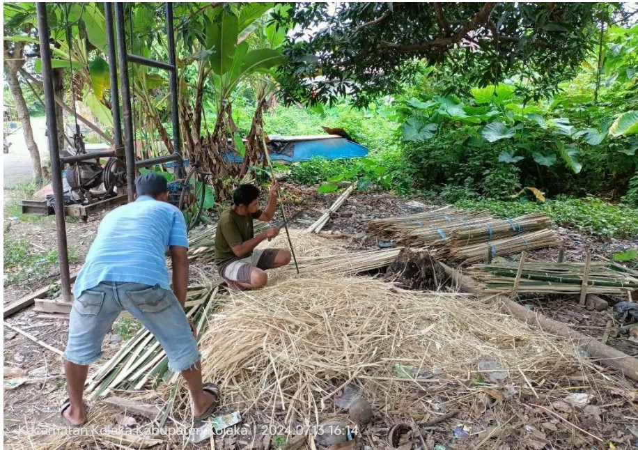
Gambar 3. Pembuatan ajir bambu oleh kelompok nelayan Sipatuo