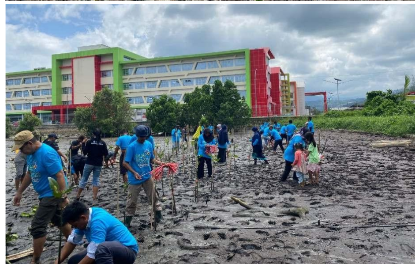
Gambar 10. Penanaman mangrove