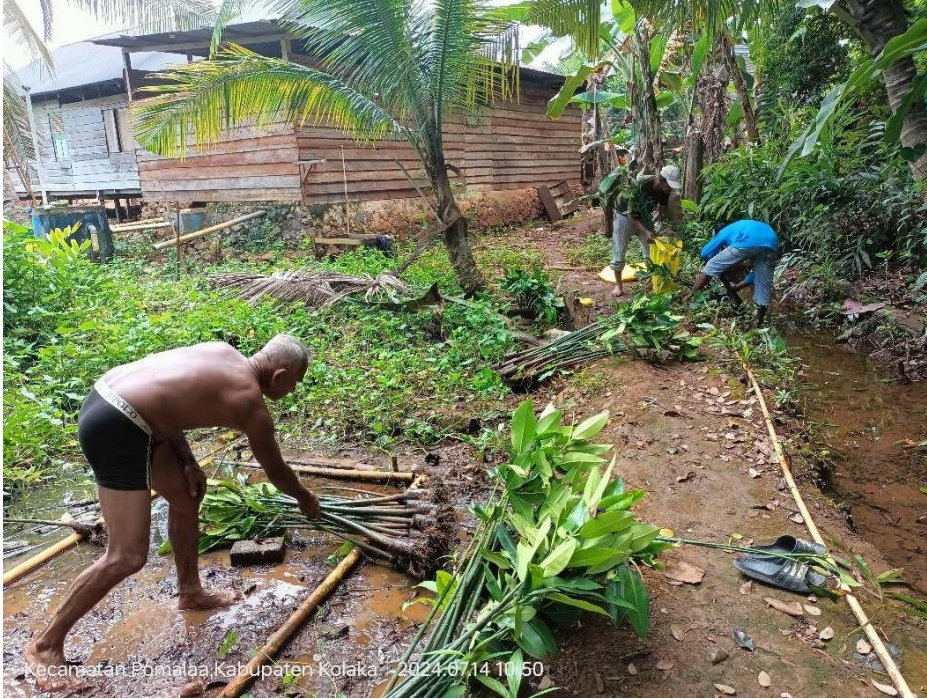
Gambar 6. Sortir bibit mangrove