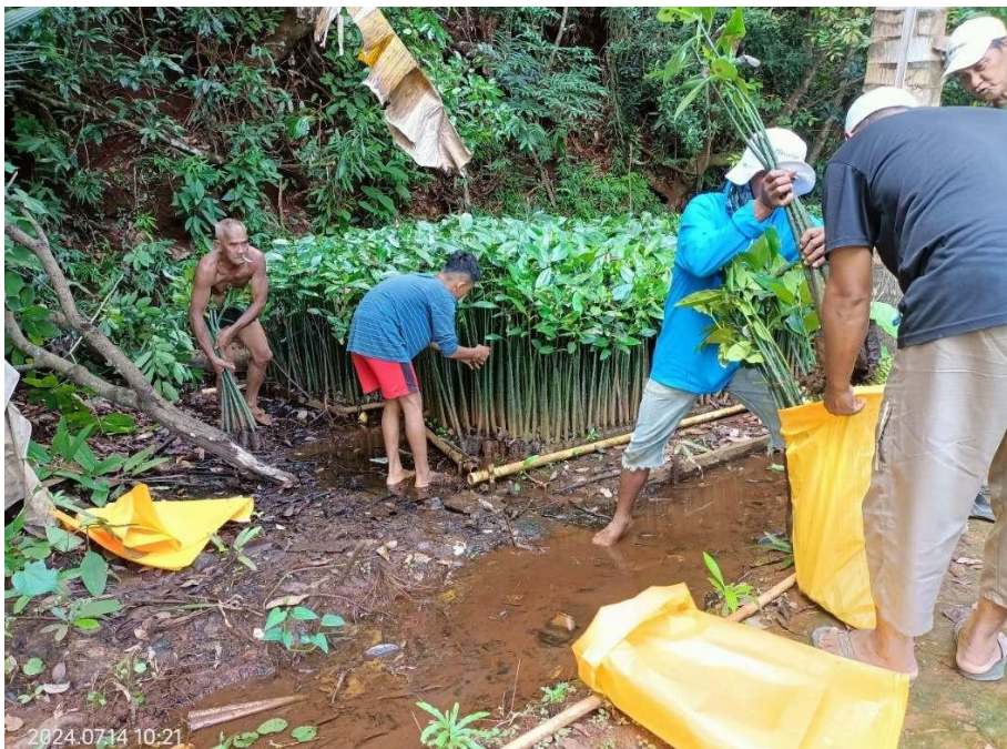
Gambar 4. Belanja bibit mangrove oleh kelompok nelayan Sipatuo