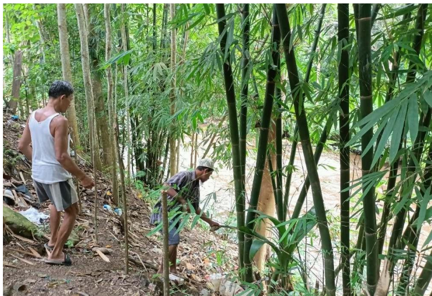
Gambar 2. Pengambilan bahan ajir bambu oleh kelompok nelayan Sipatuo

Seluruh pelaksanaan tahapan kegiatan ini dilakukan secara partisipatif oleh kelompok nelayan Sipatuo serta Masyarakat Kelurahan Tahoa, mulai dari pencarian bahan baku ajir bambu, pembuatan ajir, penyediaan bibit hingga proses penanaman. Berikut merupakan dokumentasi seluruh rangkaian kegiatan. Persiapan kegiatan yang dilakukan oleh kelompok nelayan Sipatuo senantiasa berkoordinasi dengan akademisi dari USN Kolaka sebagai pembina kelompok mulai dari penentuan spesifikasi ajir yang digunakan, pemilihan jenis dan sumber bibit, serta pemilihan lokasi penanaman mangrove dan waktu pelaksanaan yang disesuaikan dengan pasang-surut air laut. Berikut merupakan beberapa kegiatan persiapan kegiatan yang dilakukan secara partisipatif oleh kelompok nelayan Sipatuo.