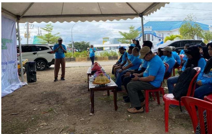
Gambar 9. Sambutan oleh Kepala Dinas Perikanan Kabupaten Kolaka