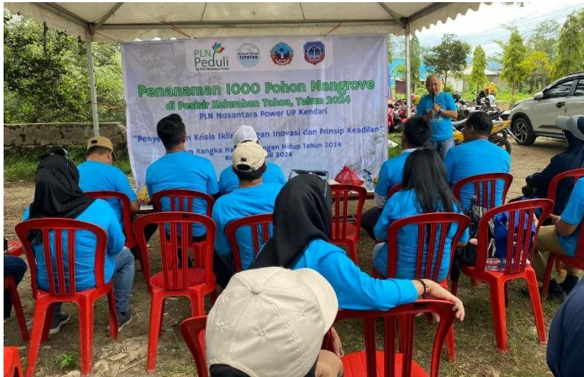
Gambar 7. Sambutan oleh perwakilan PLN Nusantara Power UP Kendari