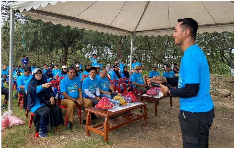
Gambar 8. Sambutan oleh Lurah Tahoa