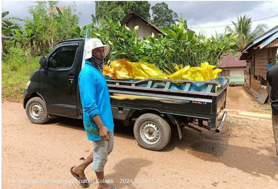
Gambar 5. Transportasi bibit mangrove oleh kelompok nelayan Sipatuo